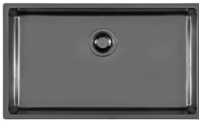
Spülbecken KE Gun Metal 2157 856