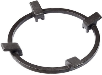
Wok-Halter aus Gusseisen 9601 727